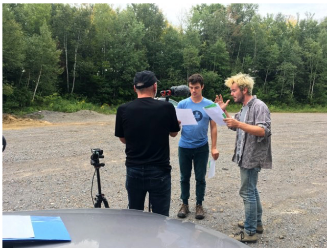
Enregistrement du balado Haut du lac , par Le Théâtre pour pas être tout seul

En permettant aux artistes de continuer à créer et à diffuser via le numérique, l'aide de Première Ovation, comme celle des autres bailleurs de fonds, a évité que le milieu théâtral se fragilise à l'extrême. Le milieu et le public ont pu sentir qu'il y avait de l'activité, que les artistes continuaient de créer, et ce, même sans contact direct avec le public.