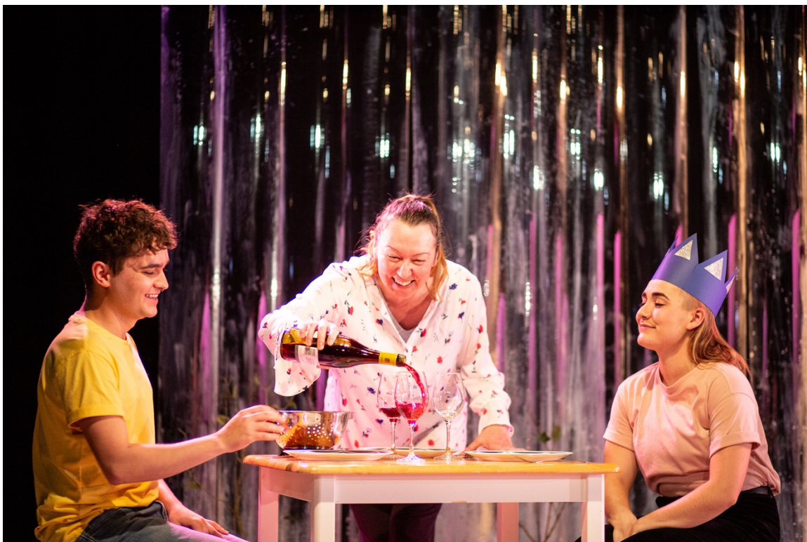
Collectif des Sœurs Amar, L'usine . Photo de Nikki ne mourra pas , Premier Acte, 2019