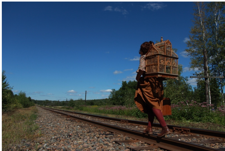
Briell, de Myriam Sutton

Le milieu des arts du cirque a été fortement touché non seulement par la pandémie, mais aussi par les difficultés très médiatisées du Cirque du Soleil, employeur important. Les différents lieux de pratique des arts du cirque ont été fermés une grande partie de l'année, empêchant les artistes de pratiquer leurs disciplines de façon sécuritaire.