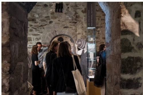
Première Ovation – Patrimoine

Pour une cinquième année, Action patrimoine assure la coordination de la mesure Première Ovation – Patrimoine.