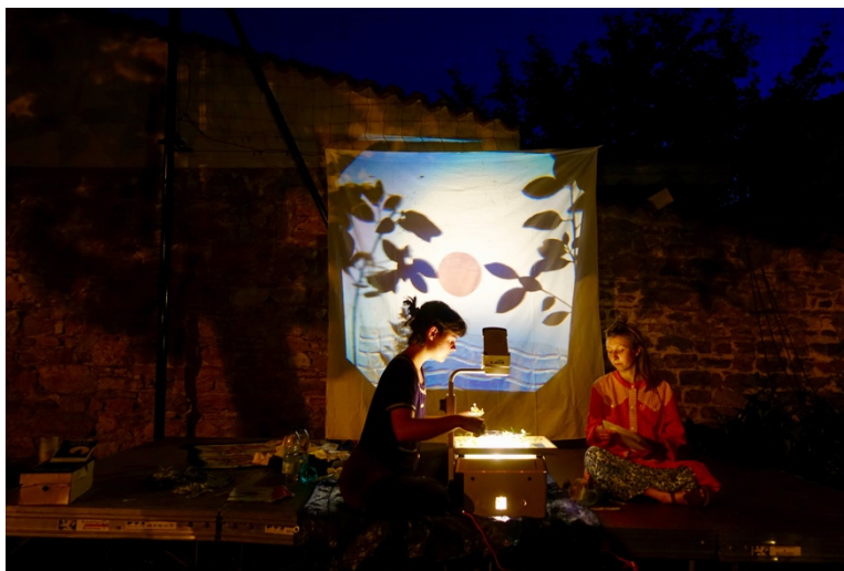
Le collectif Les Tyroliennes Saint-Jambiennes

Les artistes et collectifs d'artistes ont fait preuve d'audace et d'imagination pour s'adapter aux fluctuations des contraintes et règles de la santé publique.