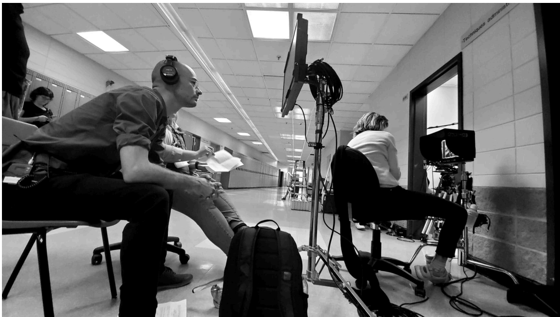
Tournage de Socrate est mortel , d'Alexandre Isabel.