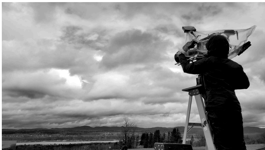
Tournage de Socrate est mortel d'Alexandre Isabel.

Lancée en 2019, la mesure Première Ovation - Cinéma se porte bien et est connue des artistes de la relève qui y déposent leurs projets. Le défi demeure de faire découvrir les volets Développement professionnel et Mentorat aux artisans qui ont moins l'habitude d'aller chercher du financement.