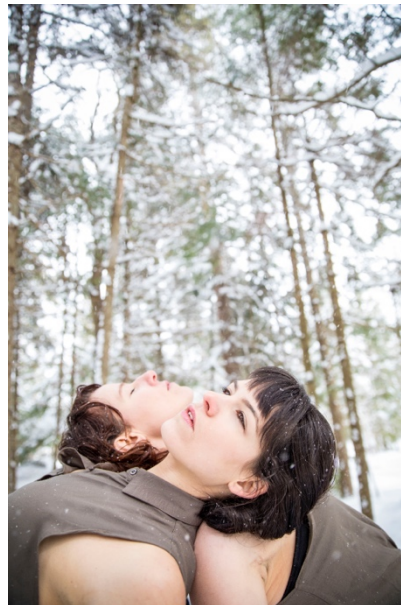
Collectif Le CRue

Malgré le contexte actuel, le soutien de Première Ovation a permis à bon nombre d'artistes de la danse de poursuivre le travail de création en studio sans perte de revenus. Pouvant ainsi conserver une certaine liberté de création et une confiance dans la poursuite d'une carrière dans ce domaine, des artistes ont même su s'affirmer davantage dans leur démarche, les contraintes ambiantes les forçant à se remettre en question et faire preuve de beaucoup d'audace. Le support de Première Ovation fut crucial dans la définition de leur processus professionnel, que ce soit dès la sortie de l'école ou dans la poursuite de leur carrière.