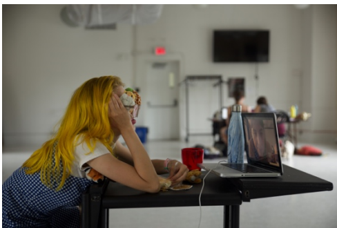
Théâtre de l'impie (projet eauX )

Sur les réseaux sociaux, les milieux touchés par la mesure Première Ovation ont l'habitude de diffuser largement les nouvelles, les projets soutenus et les événements.