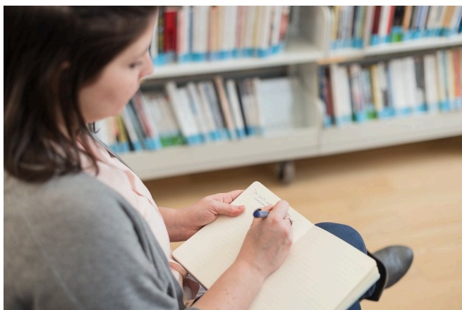
Première Ovation – Arts littéraires

Le Cercle des autrices et des auteurs de la relève s'est tenu entièrement en ligne depuis mars dernier.