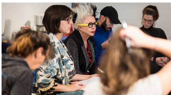
Première Ovation – Arts visuels, Orlan

Un appel de projets a été lancé à la fin du printemps 2020 auprès des organismes culturels pour l'organisation de classes de maître d'envergure internationale. Ces dossiers devaient être déposés avant le 8 juin. Parmi les 14 dossiers reçus, 10 ont été retenus, soit quatre de plus que l'an dernier. Les classes étaient devaient avoir lieu en 2020 et 2021.